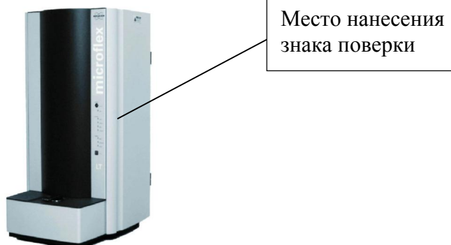
Рисунок 1 - Общий вид масс-спектрометра microflex LT/SH

Общий вид масс-спектрометров и место нанесения знака поверки приведены на рисунках 1 - 5.